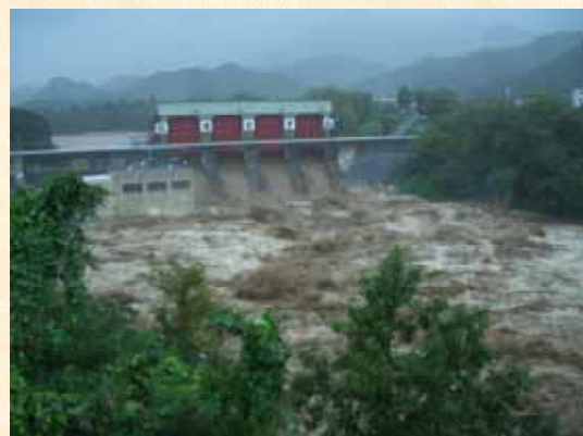
【平成16年9月 台風21号時の三瀬谷ダム】

渇水対策として宮川用水土地改良区では、かんがい開始前から地元で節水を呼びかけ、かんがい通水当初より地域を2分して隔日通水を実施したり、代掻きの分散化を呼びかけるなど取水量の減少に努めている他、地区内排水路などに仮設ポンプを15ヶ所設置し、反復利用に努めていますが、このまま雨が降らなければ、ダムの発電容量からの農業用水への融通も考えなければならない状況にあります。