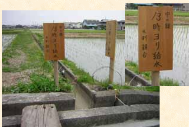
【地区内の給水制限呼びかけの立て札】

渇水対策として宮川用水土地改良区では、かんがい開始前から地元で節水を呼びかけ、かんがい通水当初より地域を2分して隔日通水を実施したり、代掻きの分散化を呼びかけるなど取水量の減少に努めている他、地区内排水路などに仮設ポンプを15ヶ所設置し、反復利用に努めていますが、このまま雨が降らなければ、ダムの発電容量からの農業用水への融通も考えなければならない状況にあります。