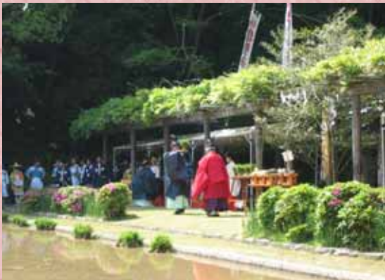
【御田祭の神饌風景】

「御田祭」は5月5日に行われ、酒や魚や果物などの神饌（しんせん）が行われた後、太鼓や笛の音が流れる中、桃山時代の衣装を着た植方が、約500m 2 の神田に昔ながらの手作業で苗を植えました。収穫は8月下旬の予定で、11月23日の新嘗祭に供えられるそうです。