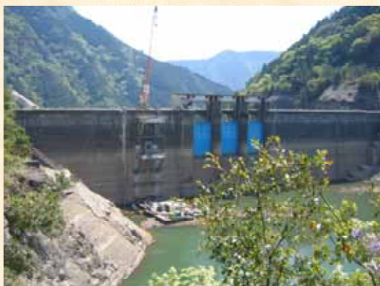
【宮川ダムの選択取水設備工事】

今年度の3月、4月の降雨が例年の34%（宮川ダム地点）と少ない上に、主水源である宮川ダムの選択取水設備工事の影響で貯水位制限を受けたことや粟生頭首工の上流にある三瀬谷ダムの上流護岸災害復旧工事（H16年被災）の関係で貯水位制限を受けたことなどが重なり、当地域では例年になく渇水となっています。