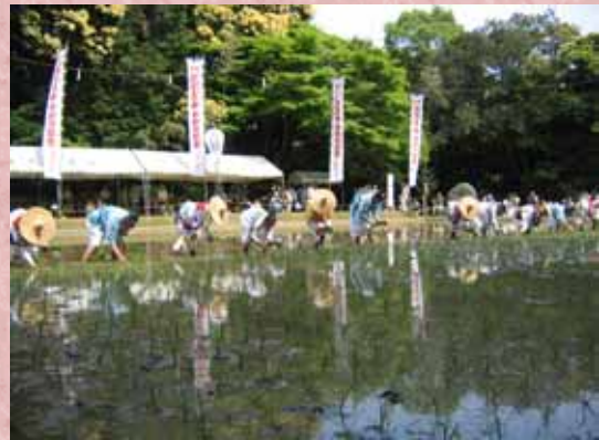
【御田祭の田植え風景】

「車田の御田植祭」は5月8日に行われ、豊作を願う神事後、太鼓の音が鳴り響く中、花笠姿の早乙女らが、半径11mの車田に円を描くように苗を植えました。収穫は9月の予定で、近長谷寺、佐奈神社、伊勢神宮に奉納するそうです。