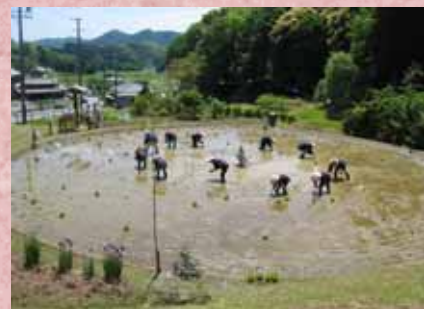
【車田の田植え風景】

「車田の御田植祭」は5月8日に行われ、豊作を願う神事後、太鼓の音が鳴り響く中、花笠姿の早乙女らが、半径11mの車田に円を描くように苗を植えました。収穫は9月の予定で、近長谷寺、佐奈神社、伊勢神宮に奉納するそうです。