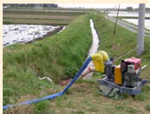
【地区内反復利用のための仮設ポンプ】

今後の降雨状況により渇水の解消もありますが、限られた水源が涸渇しないよう受益農家の方々に節水対策の継続をお願い致しますとともに、安定水源及び用水供給の確保のために現在実施しております国営宮川用水第二期事業の推進につきまして、御理解と御協力をお願い致します。