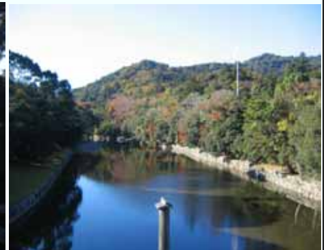
宇治橋から見た五十鈴川