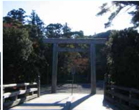
宇治橋内側の大鳥居