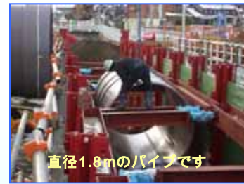
直径1.8mのパイプです