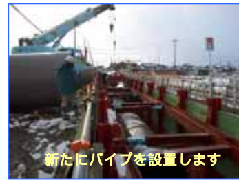
新たにパイプを設置します