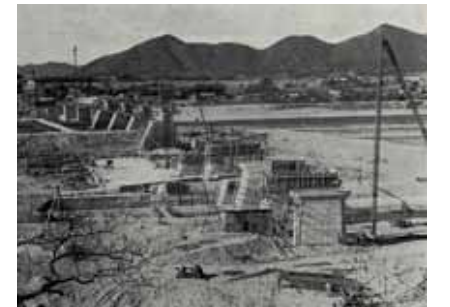
犬山頭首工築造時のようす（愛知県より岐阜県側を望む）

木曾川の河口からおよそ57kmのところ、岐阜県各務原市と愛知県犬山市をまたいで位置する「犬山頭首工」は、濃尾平野を潤す農業用水（宮田用水、木津用水、羽島用水：3つ合わせて濃尾用水といえます）を取り入れるために、農家からの申請に基づき、昭和30年代に農林水産省が築造した施設です。