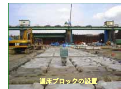
護床ブロックの設置