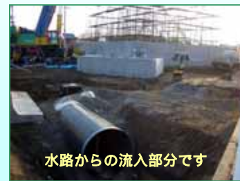
水路からの流入部分です