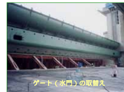
ゲート（水門）の取替