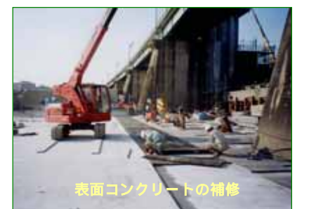
表面コンクリートの補修