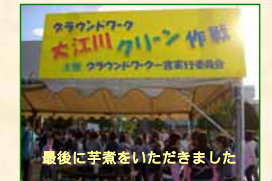
最後に芋煮をいただきました

2月5日（日）には、美和町において清掃活動が実施される予定です。今回、参加を逃した方はぜひ参加してみてください！（詳しくは裏面を参照ください）