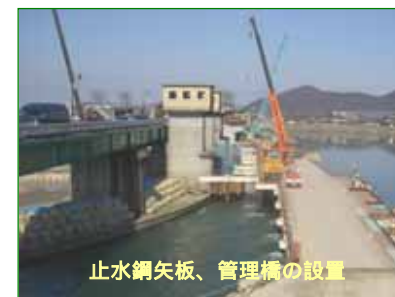
止水網矢板、管理橋の設置