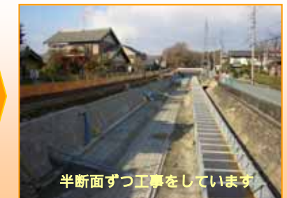
半断面ずつ工事をしています