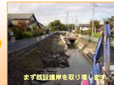
まず既設護岸を取り壊します