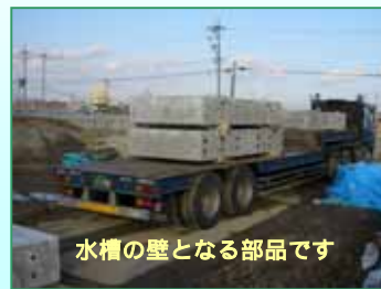
水槽の壁となる部品です