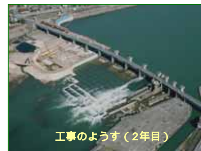
工事のようす（2年目）

河川内の工事は、洪水の危険が少ない非出水期（10月～翌年5月）に行う必要があり、6年間の計画で岐阜県側から工事を開始しました。昨年10月より最終6年目の工事を行っており、今年5月には本体の補修工事が完了する予定です。