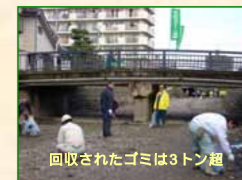
回収されたゴミは3トン超

毎年街の緑が秋の訪れと共に少し色づくこの時期に行われ、今年で7回目となるこの催しには、早朝より一般市民ら約800人が参加し、澄み切った秋晴れの下、実行委員長等の挨拶の後、参加者が5つのブロックに分れ、川底のゴミを拾ったり、沿道をほうきで掃いたりしました。