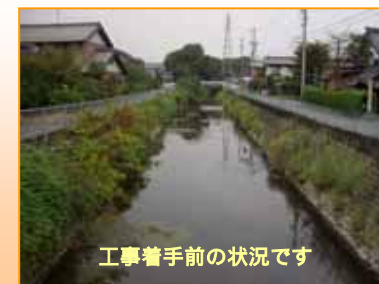
工事着手前の状況です

引き続き、仮廻し排水路を対岸に移設し、残り半断面の工事を行い、3月末の完成を目指します。