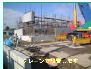
クレーンで設置します