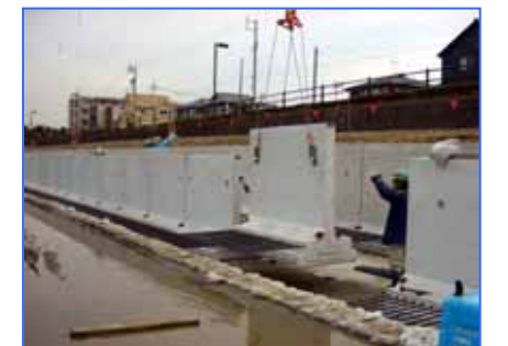
二次製品を用いて改修中の木津用水路

特に高雄小学校6年生は、卒業記念行事を兼ねての実施であり、描き終えたあと児童代表から、「木津用水の水を汚さないよう注意していきたい」等、お礼の言葉がありました。児童にとって、木津用水への愛着がますます大きくなったようで、みんなの記憶にしっかりと残る行事となりました。今回の行事により、未来に向けた小さな応援団ができ、木津用水路が従来にも増して地域の用水として親しまれるものと期待しています。