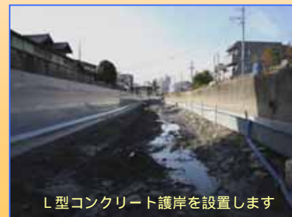
L型コンクリート護岸を設置します