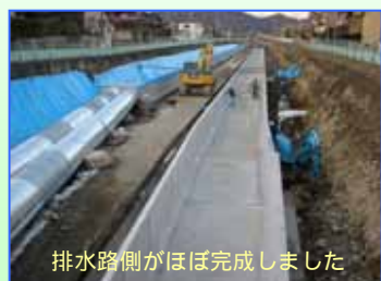
排水路側がほぼ完成しました