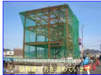
鉄骨建て方を進めています