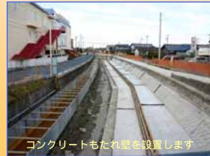
コンクリートもたれ壁を設置します

3月末の完了を目標に安全第一で工事を進めています。皆様方のご協力をよろしくお願いいたします。