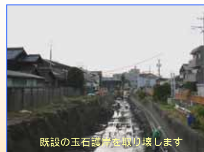
既設の玉石護岸を取り壊します