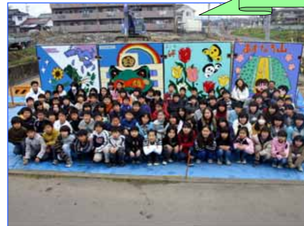
扶桑町立高雄小学校6年生の児童達