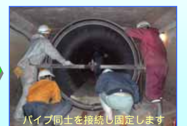
パイプ同士を接続し固定します