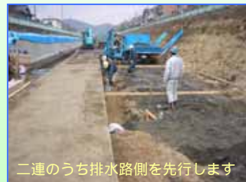
二連のうち排水路側を先行します