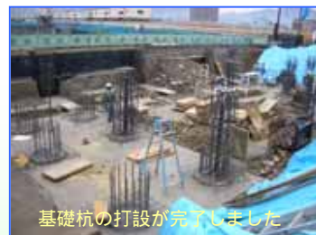
基礎杭の打設が完了しました