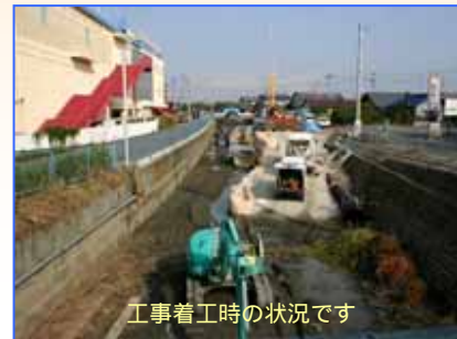
工事着工時の状況です