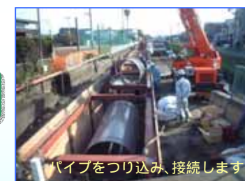
パイプをつり込み、接続します