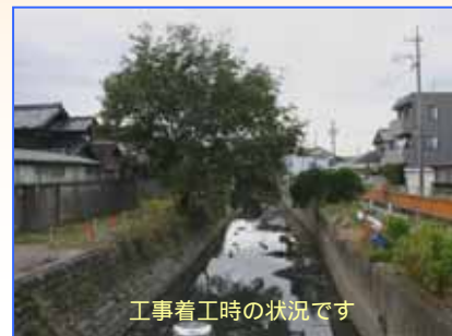
工事着工時の状況です