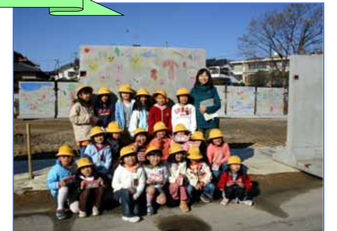
犬山市立犬山西小学校2年生(一部)の児童達