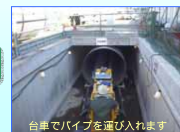
台車でパイプを運び入れます