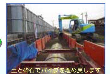
土と碎石でパイプを埋め戻します