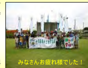
みなさんお疲れ様でした！

7月1日、宮田用水土地改良区主催による「田んぼの生きもの調査」が美和町内で行われ、周辺市町のエコきっず調査隊に交じって、当事業所職員も参加し、約40人の子供達とともに水質の調査をしたり、用排水路にいる生きもの捕獲・調査を行いました。タモ網で捕まえたカエルやドジョウなどのほか、前日から仕掛けておいたカゴ網や定置網には、大きなナマズなどの生きものが入っており、子供達は興味深く観察し、自然や農業を身近に感じることできた一日となりました。