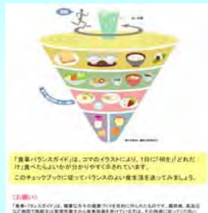
「食事バランスガイド」は、コマのイラストにより、1日に「何を」「どれだけ」食べたらよいか分かりやすく示されています。このチェックブックに従ってバランスのよい食生活を送ってみましょう。