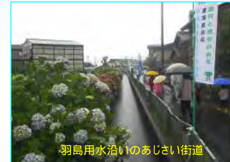
羽島用水沿いのあじさい街道

当日はあいにくの雨模様でしたが、集まっていた約200名の皆さんは元気に散策を楽しんでいたようです。