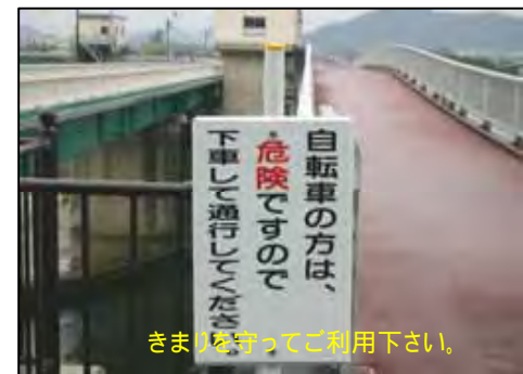
きまりを守ってご利用下さい。