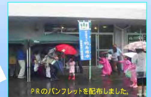
PRのパンフレットを配布しました。