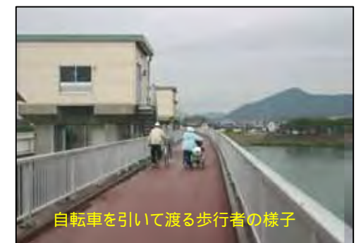
自転車を引いて渡る歩行者の様子