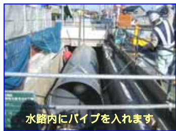
水路内にパイプを入れます