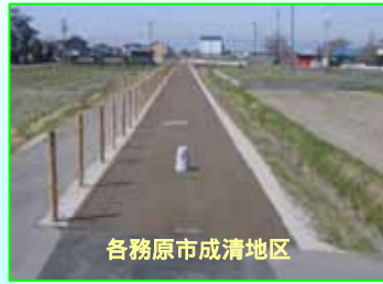
各務原市成清地区