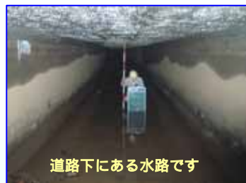
道路下にある水路です