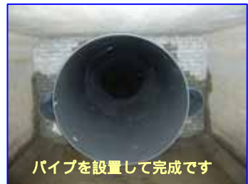
パイプを設置して完成です