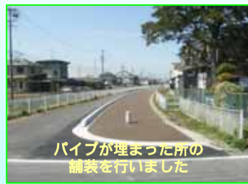
パイプが埋まった所の舗装を行いました