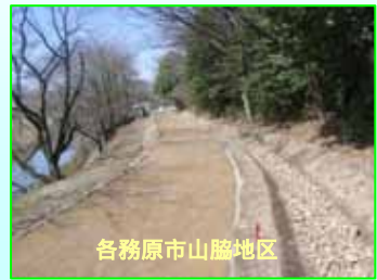
各務原市山脇地区