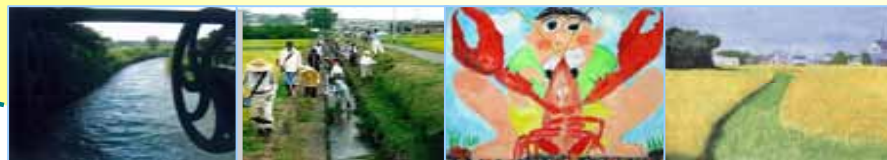
水土里ネット愛知「あいちの農業・農村フォトコンテスト入賞・入選作品」 全国水土里ネット「ふるさと田んぼと水」子ども絵画展より

〒492-8211 稲沢市稲沢町北山178 宮田用水土地改良区 総務部 庶務課まで (0587)32-4151(代) FAX(0587)21-7027 E-mail syasin-kaiga@miyatayousui.or.jp