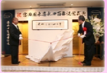
神田愛知県知事と恒川宮田用水土地改良区理事長による碑文『大地を潤し四百年』の披露

江戸時代、徳川家康の命により、木曾川の左岸に、犬山から弥富におよぶ延長約50kmの堤防(御囲堤)が築かれたため、「大野杵(おおのいり)」、「般若杵(はんにやいり)」を設けて農業用水を取り入れるようになったのが、宮田用水の始まり(1608年(慶長13年))とされ、それから今年で400年になります。 宮田用水の通水400年を記念して、神田真秋愛知県知事の揮毫(きごう)で「大地を潤し四百年」の文字が刻まれた記念碑が宮田用水土地改良区(稲沢市)に建立され、平成20年6月25日に記念碑の除幕式が行われました。また通水400年記念式典が名古屋通信会館において挙行されました。 これからも濃尾用水(宮田用水、木津用水、羽島用水)は、将来にわたって濃尾平野を潤し、農業や地域の発展に大きな役割を果たしていくことでしょう。