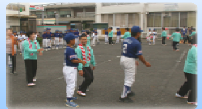
あじさい踊り&正木町音頭

岐阜県羽島市正木町の羽島用水路沿いにある「あじさい街道」では、6月8日に「正木町あじさい祭り&ウォーク」が開催され、当事業所職員も数名が参加しました。 はじめに地域の方々が挨拶され、続いて婦人会の皆さんや子ども達による「あじさい踊り」や「正木町音頭」が披露されました。その後、およそ2km程度あるあじさい街道をみんなで歩きました。 今回は、羽島用水路にもっと親しんでもらおうという試みとして、主に子供たちを対象とした羽島用水路クイズラリーというものを実施しました。クイズの問題は全2問として2箇所の地点に分けて設置し、この用水路の水はどこからきているのかな？などと問いかけました。 子ども達はクイズをやってみて「むずかし〜」「かんたんだったよ」「あそこで魚見えたー！」などなど、色々楽しんでもらえたようでした。 クイズの答え合わせ後は正解数に応じて参加賞を渡し(全員全問正解！)、同時に事業所職員と羽島用水路改良区職員からパンフレットを配布して事業PRを行いました。 当日は天気も良く、皆さん元気にあじさい街道の散策を楽しめたようです。羽島用水路クイズの評判も良かったため来年も引き続き実施し、事業のPRや地域との交流を図ってきたいと思います。