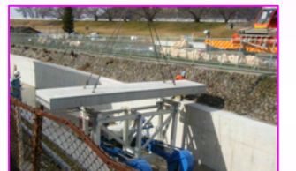
専用の特別な台車です

今年度は、宮田導水路最上流部の約0.6km（宮田導水路・木津用水分水工～犬山市西橋）の改修工事を実施しています。