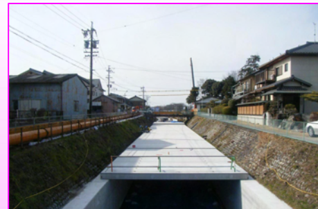
水路にふたをかけています