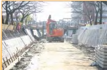
元の水路を取り壊してブロックを積んでいきます

今年度は、約1.2km（一宮市大正橋～須ヶ崎橋、下沼橋、辰巳橋）の工事を実施します。現在、大正橋～須ヶ崎橋区間では護岸となる鉄平石ブロックを設置しています。また、下沼橋の取り壊しも行っています。