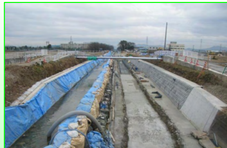
仮まわし用の水路に水を流しつつ工事を進めています

今年度は、合瀬川、五条川が合流する河川共用区間の約0.9km（木津用水路と合瀬川の合流地点～荒井堰）の他、犬山市上野橋の上下流区間、扶桑町安穩寺橋～高雄橋区間の改修工事を実施しています。