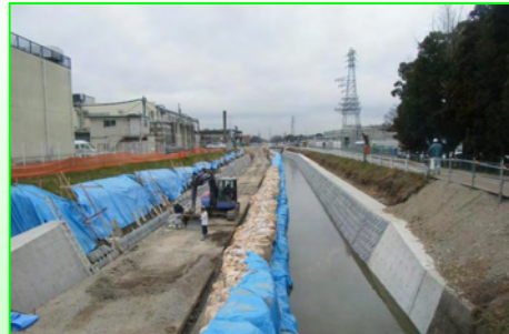
環境保全型ブロックを積んでいます