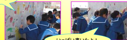
いっぱい書いたよ！

1月29日、一宮市の丹羽保育園の園児たち68名が、大江排水路の工事現場に絵を描きに来てくれました！当日は天候にも恵まれ、温かい日差しのおかげで汗ばむ園児の姿も見られました。