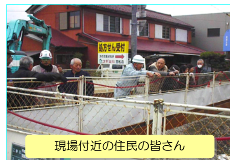
現場付近の住民の皆さん