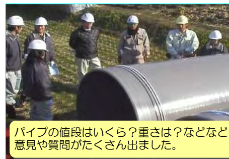
パイプの値段はいくら？重さは？などなど意見や質問がたくさん出ました。