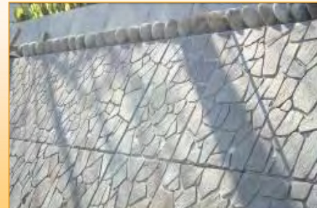
鉄平石ブロックを積みます

3月末の完了を目標に安全第一で工事を進めています。皆様方のご協力をよろしくお願いいたします。