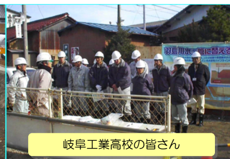
岐阜工業高校の皆さん

羽島用水路改修工事では、平成21年1月21日と27日に現場見学会を開催しました。21日には近隣住民の方々10名が、27日には岐阜工業高校建設工学科の生徒達10名が見学に来てくれました。