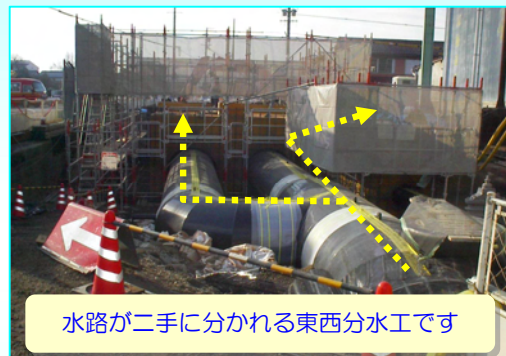
水路が二手に分かれる東西分水工です

今後は残された区間のパイプを設置し、分水工の形が出来た後に電気関係の工事を行い、3月頃の完成を目指しています。