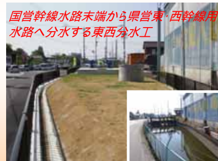
国営幹線水路末端から県営東・西幹線用水路へ分水する東西分水工