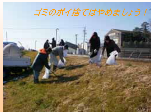
ゴミのポイ捨てはやめましょう!

清掃後、おいしい豚汁やおにぎりを頂き、綺麗になった水路を眺めながら、帰路につきました。