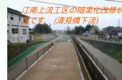
江南上流工区の暗渠化改修状況です。(清見橋下流)