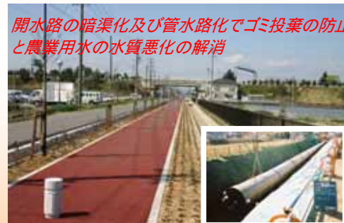
開水路の暗渠化及び管水路化でゴミ投棄の防止と農業用水の水質悪化の解消

今後の施設の維持管理については、羽島用水土地改良区にお願いすることとなりますが、引き続き農業生産の維持や農業経営の安定のみならず、地域の安全・安心に寄与することを期待します。