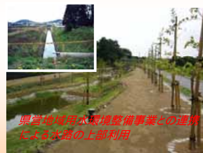
県営地域用水環境整備事業との連携による水路の上部利用

今後の羽島用水路に関するお問い合わせは、 羽島用水土地改良区 東海農政局新濃尾農地防災事業所