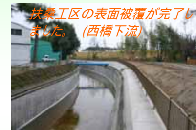
扶桑工区の表面被覆が完了しました。(西橋下流)