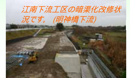
江南下流工区の暗渠化改修状況です。(明神橋下流)