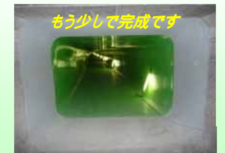
もう少しで完成です