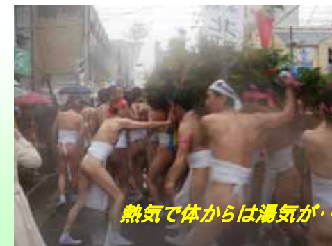
熱気で体からは湯気が...

約1240年前の奈良時代から続く厄払いの神事で、正しくは「儼追神事」(なおいしんじ)と呼ばれるこのお祭りに、約8万人の見学者が見守る熱気の中、8千人のはだか男に混じって、当事業所職員も地域の方々や肌を触れ合いながら参加し、事業の円滑な推進をはじめ、各人の願いをつづった「儼追布」をくくった笹を本殿に奉納し、祈願してきました。