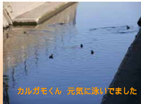
カルガモくん 元気に泳いでました