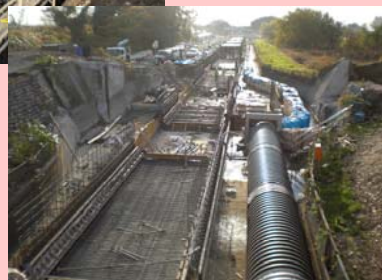
四ッ谷暗渠の施工状況