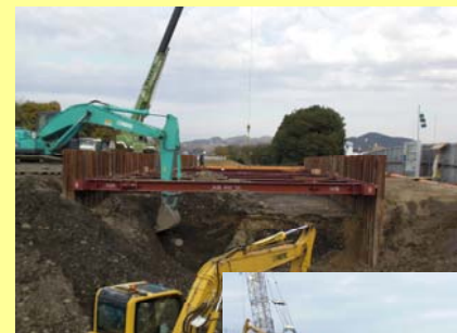
土留め工、掘削の施工状況

東洋紡績(株)犬山工場北門下の暗渠の改築工事を実施しています。土留め工を施工し、掘削を行っています。既設暗渠を撤去し、新たに工場で製作したボックスカルバートを据付ます。