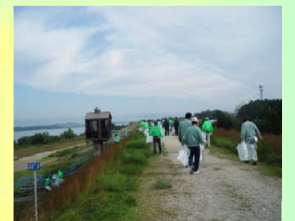
木曾川左岸の清掃状況

当日は、気持ちの良い秋晴れで、午前8時の開会式から約1時間をかけて、空き缶やペットボトル、弁当の容器等のゴミを拾い集めました。これからも、できる限りこうした地域の清掃活動に参加していきたいと思っています。