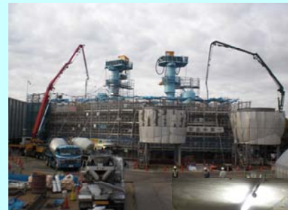
シールド発進立坑の施工状況

シールド工法により既設導水路(暗渠)の下部に用水路(サイホン)を新設します。現在は、シールドの発進立坑をニューマチックケーソン工法で施工しています。