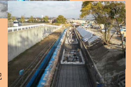
底版の鉄筋組立状況