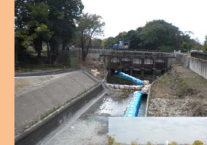
かたらい橋(神明暗渠)の撤去状況

用水と排水と分離するため、既設導水路の一部を取壊し、用水路を暗渠化する工事を実施しています。また、既設のかたらい橋(神明暗渠)を撤去し、改築します。