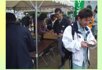
おいしいイモ煮でした