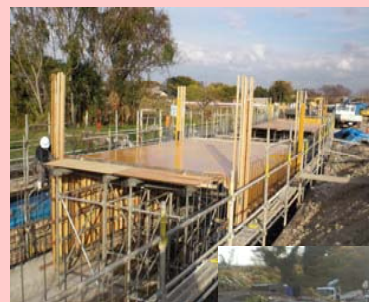
暗渠の施工状況(型枠の組立)

用水と排水と分離するため、既設導水路の一部を取壊し、用水路を暗渠化する工事を実施しています。また、既設の四ッ谷暗渠、河沼橋を撤去し、改築します。