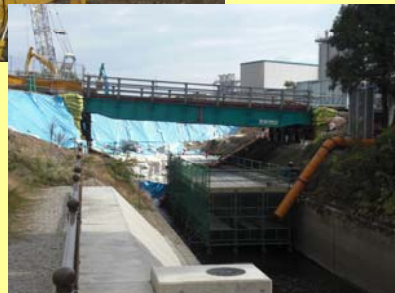
仮設橋梁の設置状況