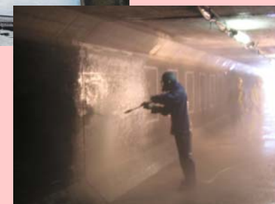
既設暗渠の洗浄状況