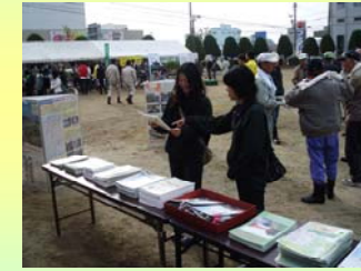
事業などをPRしました