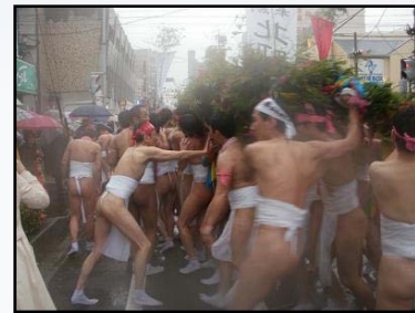
昨年の裸まつりの様子

毎年、国府宮（尾張大国霊神社）で行われる「はだか祭」は、正しくは「儼追神事」（なおいしんじ）といい、今から約1240年前、奈良時代に称徳天皇が全国の国分寺に「悪疫退散を祈れ」と勅命を発し、時の尾張国司が、尾張総社である国府宮で厄払いをしたものが、儼追神事となって現在まで伝えられています。