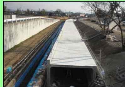
上流側の暗渠のコンクリート打設が完了

上流側暗渠のコンクリート打設が完了し、埋め戻しを実施しています。下流部のかたらい橋についても暗渠のコンクリート工事の施工中です。かたらい橋が完成すれば、現在のフラワーパークへの仮廻し道路を切り替える予定です。