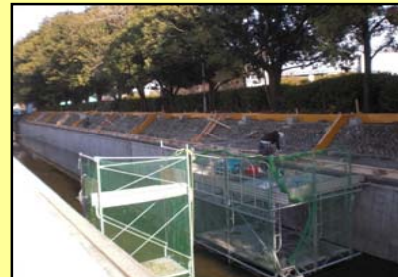
左岸護岸法面保護工の吹き付けコンクリートの型枠設置状況