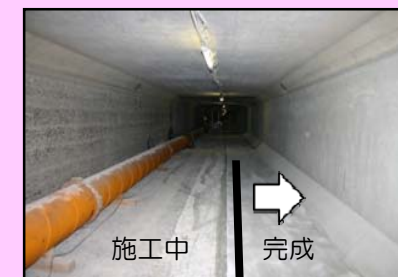
右岸側の表面被覆工の完成状況

右岸側の表面被覆工が完成し、仮廻し水路を右岸側に移設して、左岸側の底版の切削を実施しています。左岸側の切削が完了後、表面被覆工を順次施工していきます。