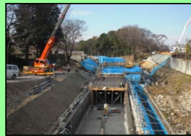
かたらい橋暗渠のコンクリート工事施工状況