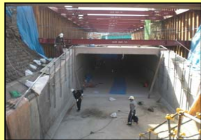
取付水路増厚コンクリート施工状況

東洋紡北門部のボックスカルバート据付が完了し、既設開水路との取付水路の工事を実施しています。取付水路が完成すれば、いよいよ埋め戻しにかかります。また、左岸護岸では、法面保護工として吹き付けコンクリートの施工の準備をしています。