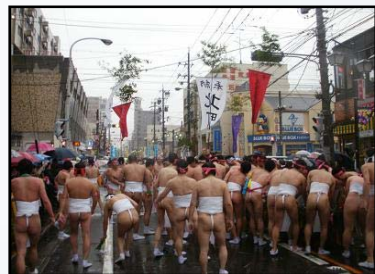
数千の裸男が集まります