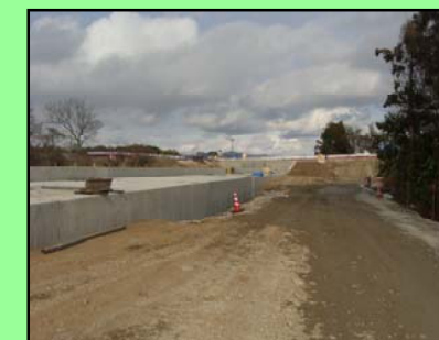
暗渠の埋戻し状況