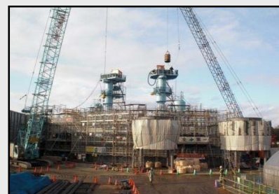
機装設備設置状況