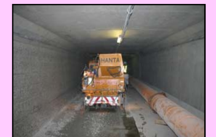
左岸側の底版表層部の切削状況