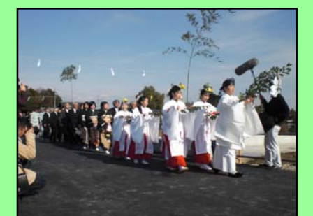
渡り初めのようす