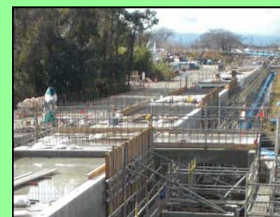
四ッ谷暗渠の施工状況

1月23日、川島神社の参道に架かる橋において、その保全と交通の安全を祈る祭典が行われました。