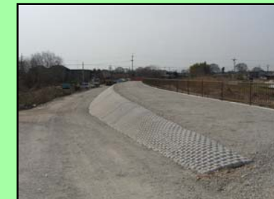
暗渠及び管理用道路完成