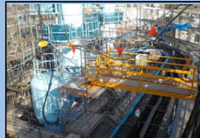
機装(ぎそう)設備の 配筋施工状況