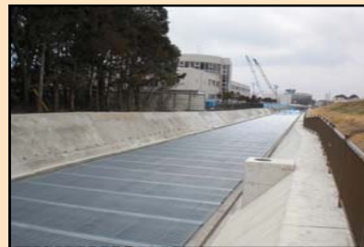
左岸護岸法面保護工の 吹き付けコンクリート施工状況