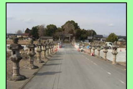
川島神社参道(河沼橋)