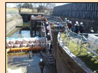
いざ、宮田導水路へ！