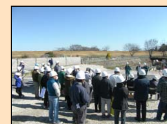
地元の皆さんが参加