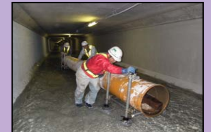
仮返し水路撤去状況