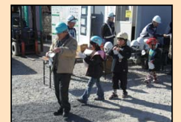
ヘルメット、マスク、軍手を配布 児童はヘルメットを持参