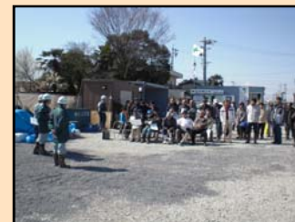
工事見学会の様子

また、この見学会をきっかけに、新しく生まれ変わった宮田導水路に対して、末永く愛着を持ち、濃尾用水の歴史や水路の役割、ひいては農業に対する関心が高まってくれることを担当者一同期待しています。