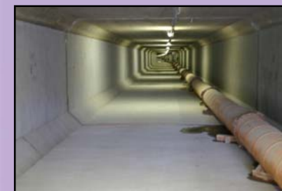
左岸側の表面被覆工の 完了完成状況