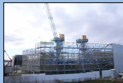
機装(ぎそう)設備の 施工状況

本工事は、扶桑町山那から江南市中般若町までの約2km区間で、既設宮田導水路(暗渠)下にシールド工法より用水路(サイホン)を新設します。昨年6月からシールド工の発進立坑建設をニューマチックケーソン工法で進めており、3月18日に仮側壁の最終リフトのコンクリート打設を終えました。構造物が地上に出現したときにはビルでも建つのかと思われていた景色も、掘削沈下で徐々に下がり、残りの掘削深さも5mとなりました。掘削沈下のあとは、ケーソン内の作業室と側壁まわりをコンクリートで埋めて発進立坑完成となります。工期は、平成25年3月までありますので、今後ともご理解とご協力をよろしくお願い致します。