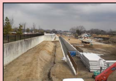
上流の暗渠の完成