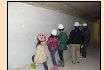
宮田導水路の思い出 未来へのメッセージ