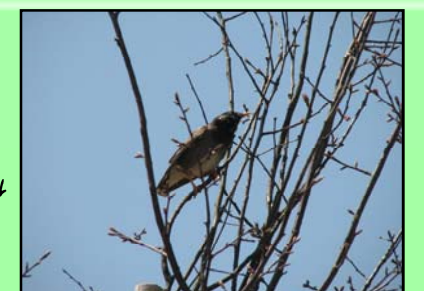
現場付近でみかけたムクドリ