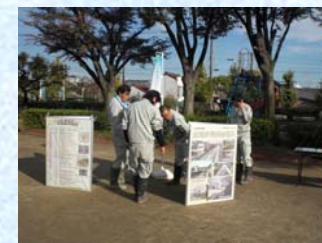
農業農村整備事業のパネル展示