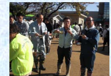
美味しい芋煮を頂きました