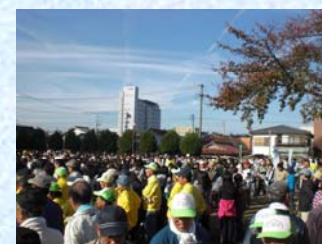
会場のようす(天道公園)

事業所では、この機会に愛知県尾張農林水産事務所一宮支所、宮田用水土地改良区と共同で、農業農村整備事業などを紹介するパネル展示やパンフレット配布を行いました。この取組に参加して、都市地域における農業水利施設の保全に当たっては、住民の皆さんの理解と自発的な協働活動が大きな力になることを改めて感じました。