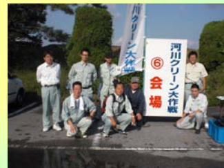
会場のようす(尾西プール)