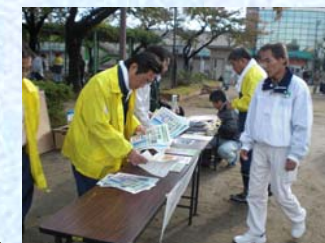
パンフレットの配布