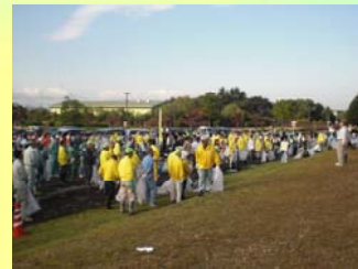
会場のようす(一宮タワー)

このような清掃活動は、「大江川クリーン作戦(一宮市)」、「クリーンコミュニケーションin大江川&蟹江川(あま市)」でも予定されており、事業所では、こうしたボランティア活動に積極的に参加していきたいと思っています。