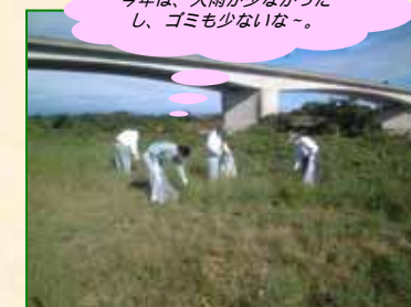
今年は、大雨が少なかったし、ゴミも少ないな。