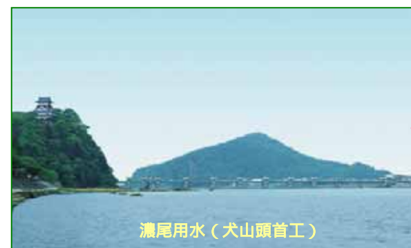
濃尾用水(犬山頭首工)