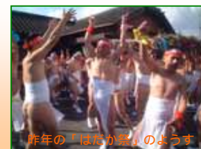
昨年の「はだか祭」のようす