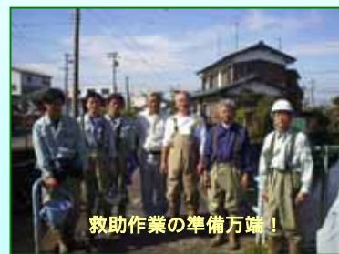
救助作業の準備万端！