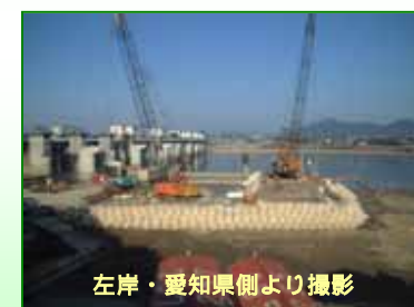
左岸・愛知県側より撮影