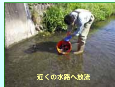
近くの水路へ放流