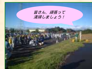
皆さん、頑張って清掃しましょう！