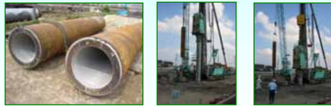
徳田調圧施設工事のようす（直径80cmの杭を打ち込んでいます）

用水路工事については、現在、断水が完了し既設水路取り壊しの準備を行っています。調圧施設工事については、現在、水槽の基礎杭の設置が完了したところであり、引き続き建物の工事にかかります。