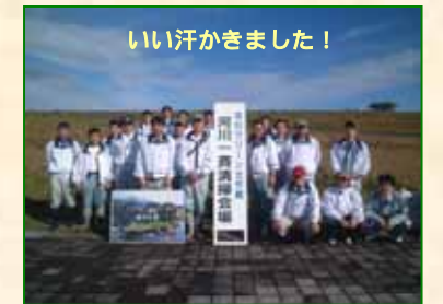
いい汗かきました！