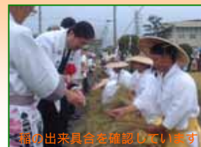
稲の出来具合を確認しています