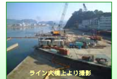
ライン大橋上より撮影