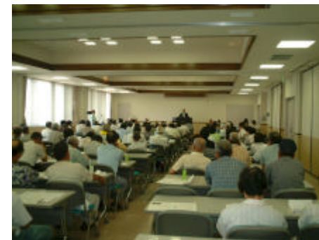
地域農業管理施設研修風景