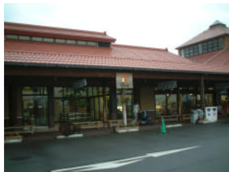
農畜産物処理加工施設外観