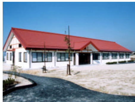
地域農業管理施設外観