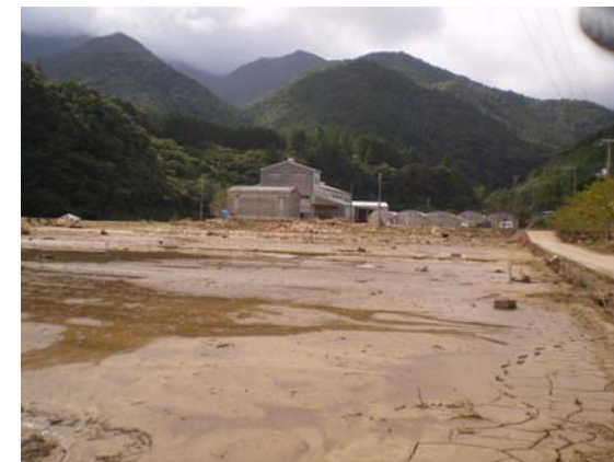
農地の土砂埋没(紀宝町高岡地区)