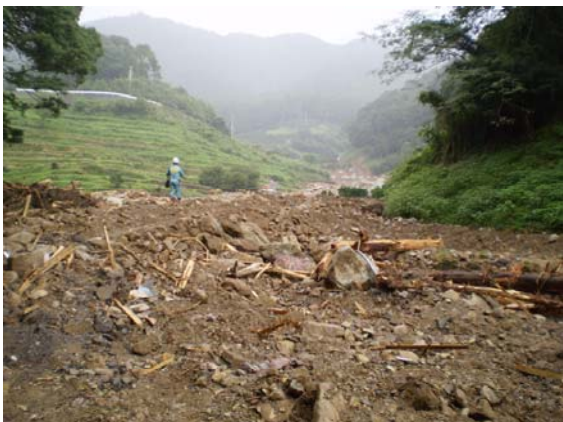
土砂・立木による農地の埋没(熊野市金山町)

平成23年9月1日～4日にかけて台風12号が紀伊半島に記録的な豪雨をもたらしました。三重県熊野市、御浜町、紀宝町の農地・農業用施設に多大な被害が発生したことを受け、東海農政局は、9月12日に担当者を同市町に派遣し、三重県担当職員と合同で被災状況を調査するとともに、被災現地において災害復旧事業等に関する助言を行いました。