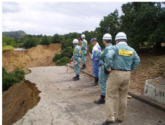
農地及び農道の崩落(御浜町志原地区)