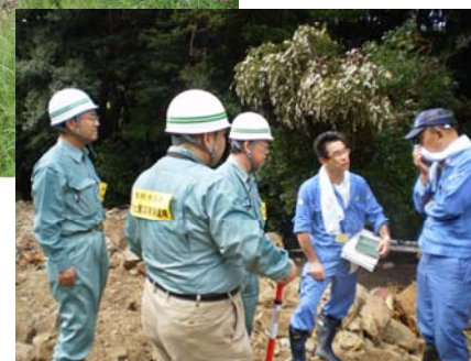
三重県との現地調査状況