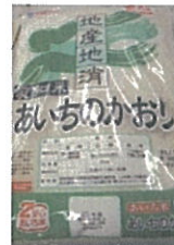
あいちのかおり (愛知県産)