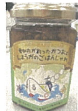
平松食品の かつおジュレ