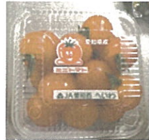
ミニトマト (愛知県産)