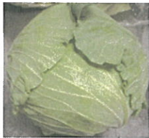
キャベツ (三重県産)