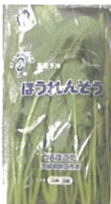
ほうれん草 (群馬県産)