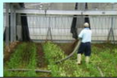
ブローア-散布車による堆肥散布