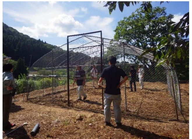
古材を利用したサル用大型箱わな