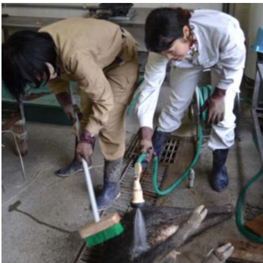
イノシシの解体作業準備