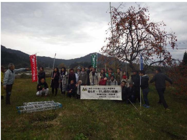
大学生の放任果樹管理体験