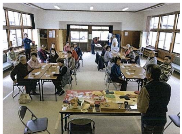
イノシシ皮革のレザークラフト教室