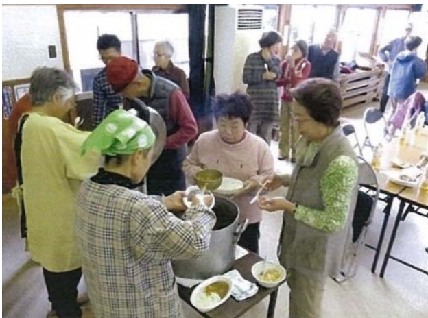
イノシシ肉のジビエ料理試食