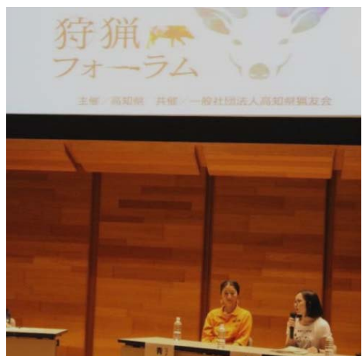
狩猟フォーラムにパネリストとして参加