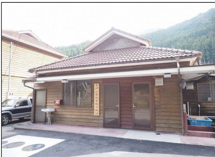
那賀町木沢シカ肉等加工施設