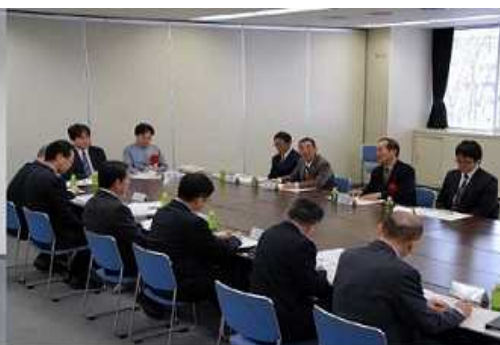
・意見交換会の様子