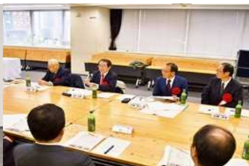
・意見交換会の様子