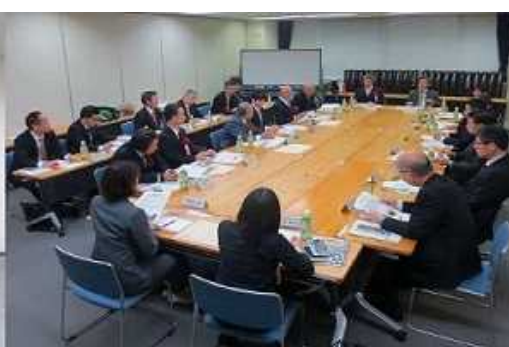
・意見交換会の様子