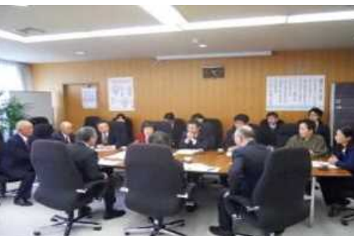
・意見交換会の様子