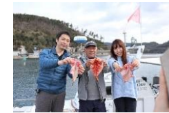
干物づくりの様子