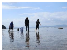
漁業、サザエ採り体験