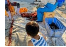
サザエを網からはずす作業