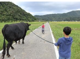
伝統の突き牛を散歩させる