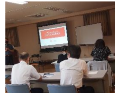
セミナーを企画開催