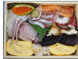
隠岐食材で試作した折詰