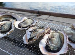
特産の岩ガキを体験商品に