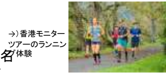
→香港モニターツアーのランニング体験

・ モニターツアーの実施 国内外からのモニターツアーを実施。香港からは25名のランナーに参加(内22名は自費参加)いただき、里地里山の自然を体感いただくなど、南部町ならではの体験をしていただくとともに効果検証を行う。