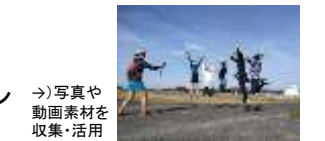
→写真や動画素材を収集・活用

・ 広報／広告活動の実施 プロモーション素材である写真や動画・ランニングコースをSNSの広告掲載等活用し、ランニングコミュニティへの浸透を図るとともに、予約WEBサイトの立ち上げ。