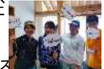
←インフルエンサーを招聘したモニターツアー

・ 南部町地域のブランド強化 地域の資源を再認識し、外部へわかりやすくPRするため、食・体験・宿泊の新商品開発につなげる。