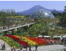
とっとり花回廊 四季を通じて楽しめる日本最大級のフラワーパーク