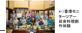
←香港モニターツアー田舎料理創作体験

・ マーケティングの実施 専門家ヘリサーチ協力を依頼し、テストマーケティングを実施する。