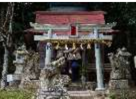
赤猪岩神社(あかいいわじんじや) 日本で唯一「再生・復活」の御利益がある