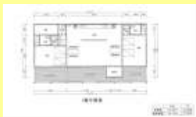
県央ツーリズムセンターの平面図