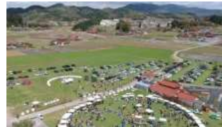
セントルマルシェ開催の風景