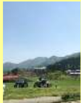
県央ツーリズムセンター建設予定地の周辺風景