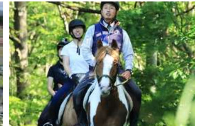
ホーストレッキング体験の造成風景