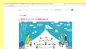
県央地区の紹介ページ