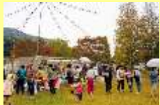
昨年度秋に開催したセントルマルシェ