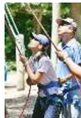
チームビルディング