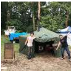
テントサウナ体験ツアー