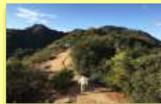
自然や特産品を活用した体験