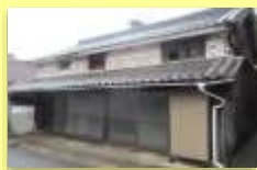
改修予定建物 (飲食店設立予定)