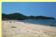
白石島海水浴場 (代表的な観光資源)