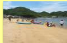
白石島の魅力をパンフレットでPR