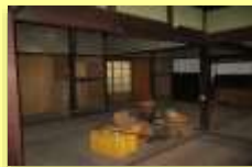
港に近接した場所に飲食店新設予定