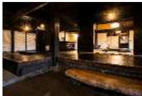
施設整備対象施設