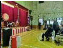
地域住民も招待した 完成披露会