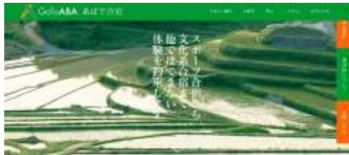
合宿案内ホームページ