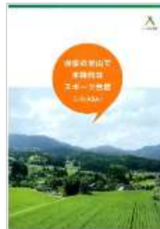
合宿案内パンフレット