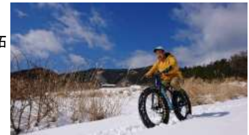
マウンテンバイクのトレイル