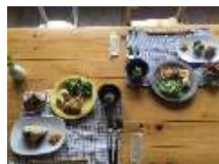
地元食材を使い、砂糖不使用のヘルシー朝食