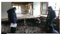
施設現地確認状況