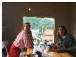
外国人旅行者の利用