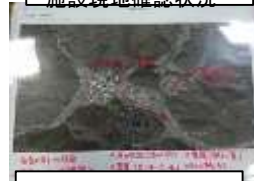
当地区の上空写真