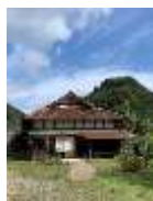
日貫一日・安田邸