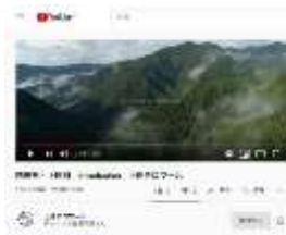
プロモーションムービー配信