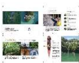
ガイドングブック