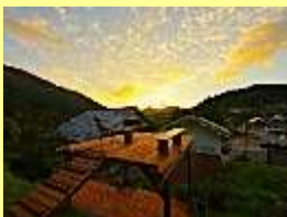
サンセットツアー