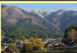
岡山県最高峰 後山

○野菜や魚など、地域の農産物を収穫する体験プログラムと、グランピングの要素を取り入れた空間でのアウトドアクッキング体験を組み合わせ、若者やファミリー層の集客を図った。さらに、岡山県最高峰の景観を活かし、サンセットツアー体験なども開発予定。