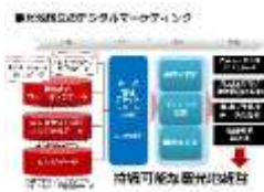
デジタルマーケティング