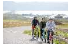
島サイクリング体験