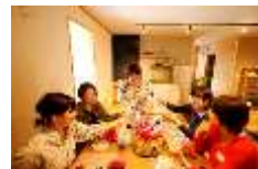
ハーバリウム創作体験