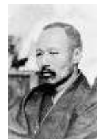
津和野出身文豪 森鷗外