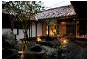
富裕層向けの宿泊施設