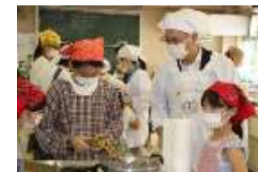
文京区での芋煮教室