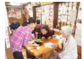
文京区民モニターツアー