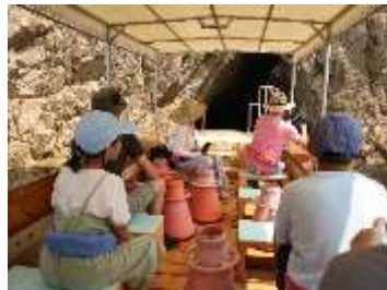
町内ツアーの企画