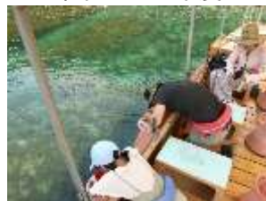
透明度の高い美しい海