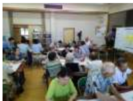
農泊への地域合意の形成