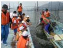
定置網(つぼ網)漁の体験学習