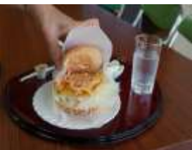
試作した大島バーガー