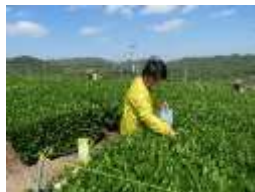
西日本最大級の茶園 茶摘み体験