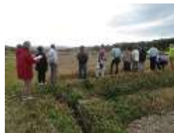
地域の魅力再発見 研修会