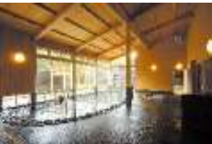
温泉 くすくすの湯