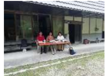
古民家コミュニティハウス計画