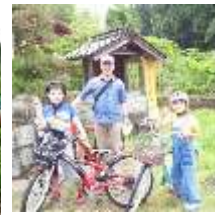
農山村ポタリング