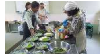
おいしいレシピ掘り起し