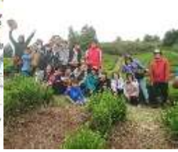
体験メニューづくり