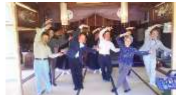
#みよし川西(インスタ)発信