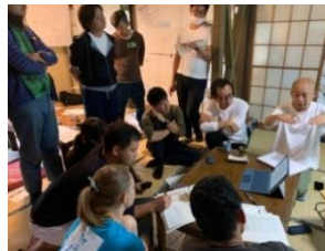
ファームステイ(農泊)開業合宿