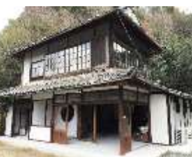
令和2年1月時(整備途中)の古民家