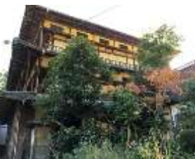
宿泊は小藪温泉旅館へ(木造3階建て登録有形文化財)