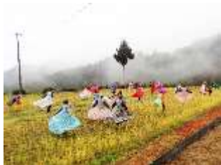
棚田で実施したダンス公演