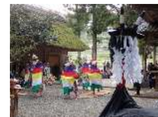
モニターツアーで好評だった地元料理(左)と棚田にある神社の秋祭り(右)