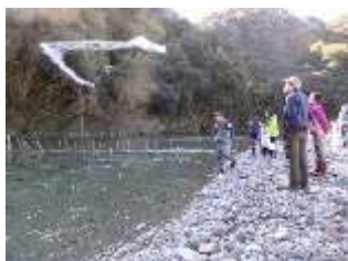
肱川でアユの瀬張り漁体験