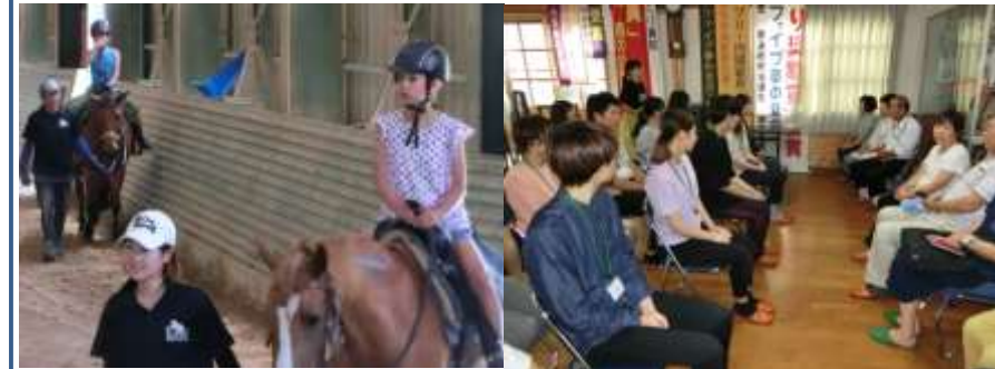
子どもたちの乗馬体験