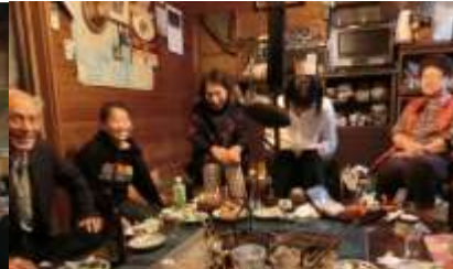
民泊体験先進地研修