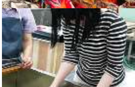
和紙・紙漉き体験