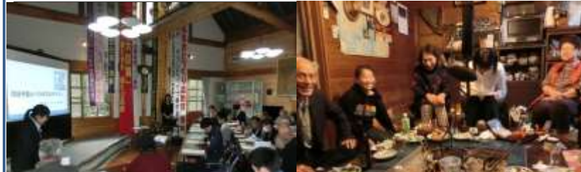
インバウンドセミナー開催