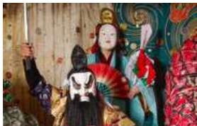
日本遺産・石見神楽