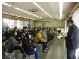
農家民泊体験モニターの様子