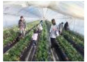
イチゴ狩りやブルーベリー狩りが楽しめる水車の里フルーツピア