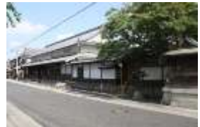
国の重要文化財に指定されている旧矢掛本陣石井家住宅