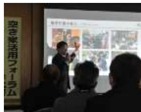
農家民宿の開業セミナー