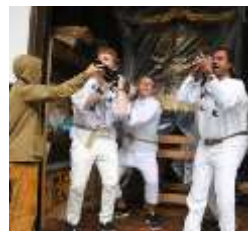
ツアーでの神輿体験