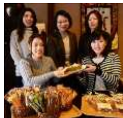
商品開発の発表会