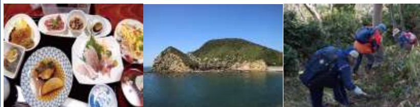
島の家料理の商品化 日本のガラパゴス“伊島” エコツアーの実施