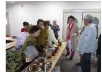
食の開発に向けた取組