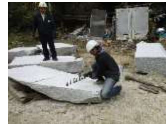
FAMツアー(石割り体験)