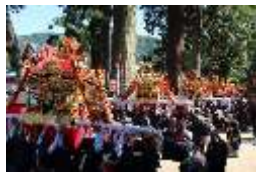
伝統的な祭・加茂大祭の様子