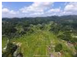
吉備中央町の風景