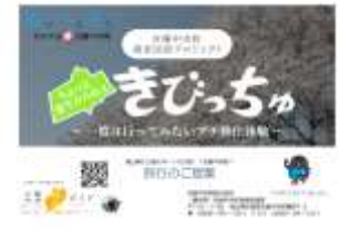
教育旅行提案用冊子の表紙