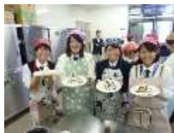
モニターツアーの実施状況 ハラル認証米粉料理教室