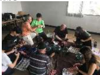
ビン玉ロープワーク体験を販売