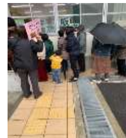
たのしいらバーガー販売