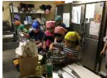
地元の子供たちが魚ハンバーガーレシピを開発