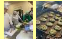
海・山それぞれの地域特性に合った体験商品造成