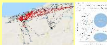
マーケティング調査