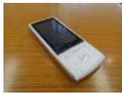
オフラインでも使用可能な翻訳機