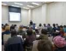
民泊ルール勉強会