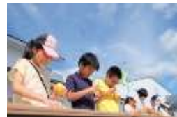
フルーツ王国 世羅高原夢まつり