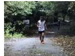
モニターツアー(ランニング)