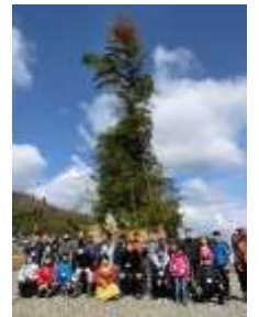
モニターツアー (インバウンド・とんど体験)