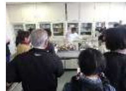
メニュー開発講習会